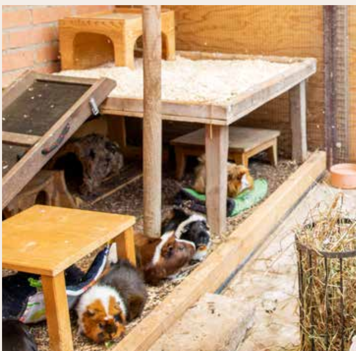
Hier ist es kuschlig.

Auch die Meerschweinchen und Kaninchen besuchen wir. Sie haben ein wahres Paradies zum Leben. Im Innenbereich gibt es ganz viel warmes Stroh, in dem sie sich verkriechen können. Es hat kuschelige Hängematten und Plätzchen zum Geniessen. Im Erdbereich dürfen sie buddeln, und es hat eingebettete Rohre, in denen sie sich an warmen Tagen abkühlen können. Und draussen auf ihrer Wiese