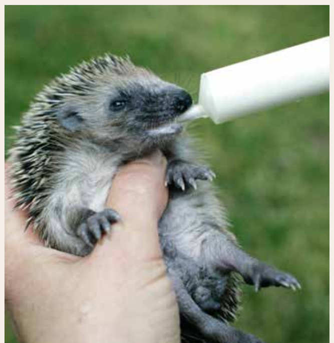
Er bekommt stündlich – auch nachts! – seine Nahrung.