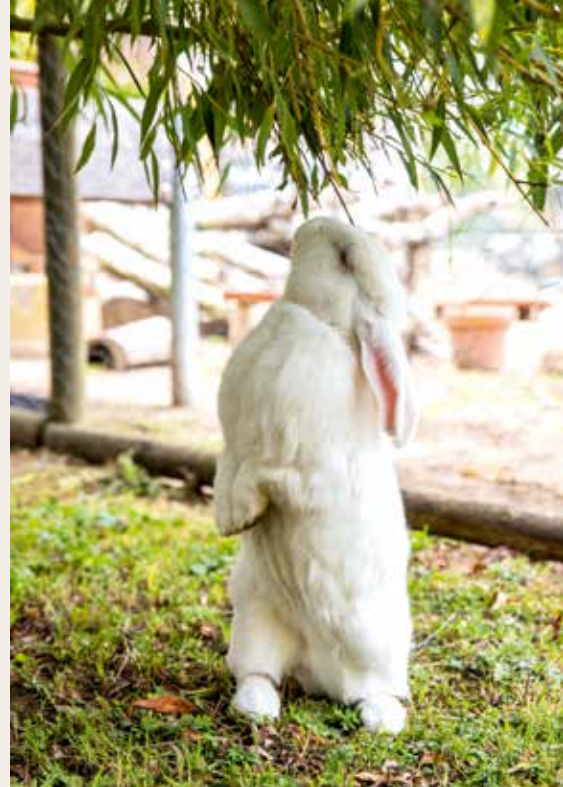
Ich liebe es, zu entdecken.

Leider bekommen sie in den letzten Jahren immer mehr verletzte Igel gebracht. Viele mit nur drei Beinen. Dass die heute so verbreiteten elektrischen Rasenmäher, die ohne menschliches Zutun den Rasen mä-