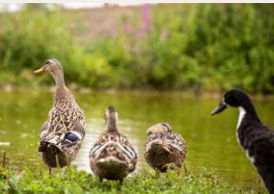
Es hat Platz für alle – auch für Wildtiere.